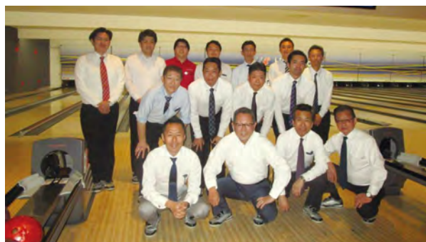
ボウリング大会参加者の皆様