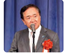
黒岩 祐治 神奈川県知事