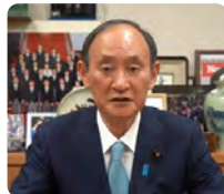
菅 義偉 ビデオメッセージ