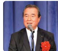
桐生 秀昭 神奈川県議会議員