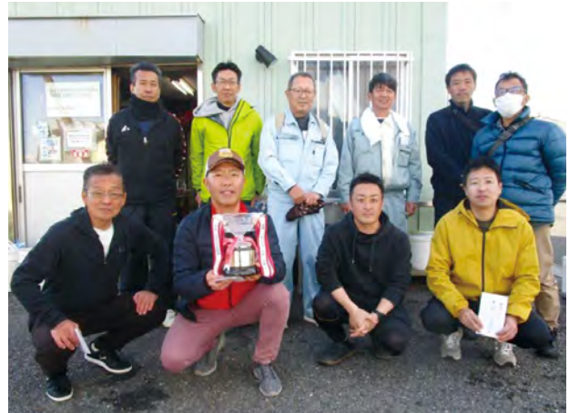
釣り大会参加者の皆様