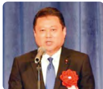
瀬之間 康浩 横浜市会議員