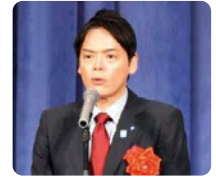
山中 竹春 横浜市長