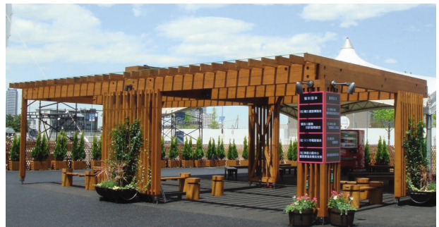
建設団体8団体が協賛して設置した Y150 トゥモローパーク内のパーゴラ