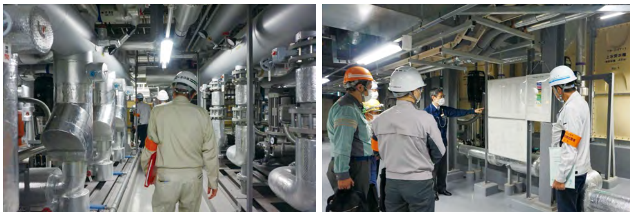
横浜市役所本庁舎における訓練

令和4年9月22日(木)に「横浜市公共建築物に係わる震災時の応急措置の協力に関する協定」に基づき、災害時の迅速な防災拠点の確保に向けた即時出動訓練が、横浜市と出動協定をしている建設6団体の横浜建設業協会、神奈川県建設業協会横浜支部、横浜市電設協会、神奈川県電業協会、神奈川県中小建設業協会横浜支部、当神奈川県空調衛生工業会の即時出動者会員が出動し、特に震災時の重要な拠点となり、中心的な役割を果たす市庁舎をはじめ区庁舎、消防署、病院等で実施されました。